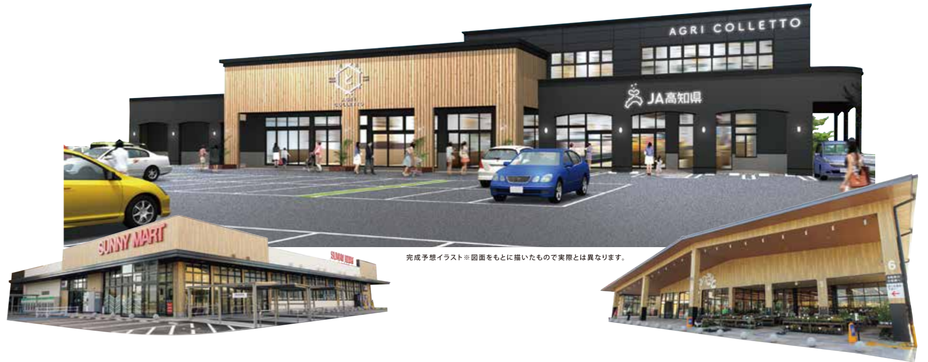
完成予想イラスト※図面をもとに描いたもので実際とは異なります。